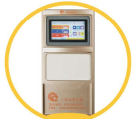
7寸真彩触摸屏 白板设计透明插页框