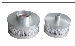
(进出风过滤器)【标配】